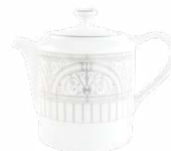
Théière Teapot 55 cl - 18.5 oz H : 13,5 cm - 5.3" Réf. 31370 450 0410