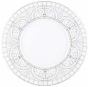
Assiette de présentation Underplate Ø : 32 cm - 12.6" Réf. 31370 354 0029