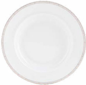
Plat rond creux Deep platter Ø : 31,5 cm - 12.4" Réf. 31370 128 0035