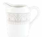
Crémier Creamer 26 cl - 8.8 oz Réf. 31370 450 0430