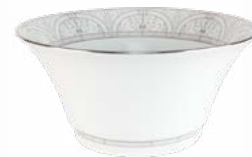
Saladier Salad bowl 200 cl - 67.6" Ø : 26 cm - 10.2" Réf. 31370 349 0053