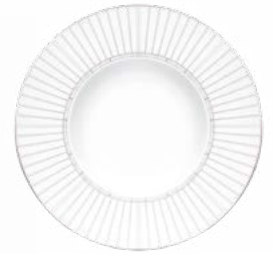
Assiette creuse à aile Rim soup plate Ø : 28,5 cm - 11.2" Réf. 31370 354 0130