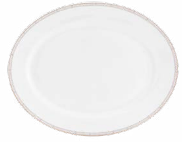
Plat ovale Oval dish L : 40 cm - 15.7" l : 31,5 - 12.4" Réf. 31370 301 0042