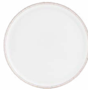
Plat à tarte Tart platter Ø : 31,5 cm - 12.4" Réf. 31370 111 0071