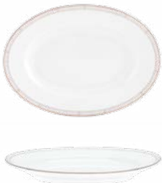
Ravier Pickle dish L : 23 cm - 9" l : 16,4 cm - 6.4" Réf. 31370 128 0065