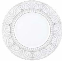
Assiette gastronomie Large dinner plate Ø : 29,5 cm - 11.6" Réf. 31370 354 0022