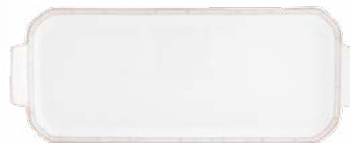
Plat à cake Oblong cake platter L : 39 cm - 15.4" l : 15,5 cm - 6.1" Réf. 31370 349 0073