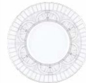
Assiette à pain Bread & butter plate Ø : 16 cm - 6.3" Réf. 31370 349 0010