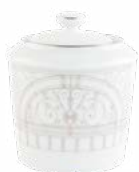
Sucrier Sugar box 30 cl - 10.1 oz Réf. 31370 123 0421