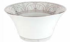
Bol à céréales Cereal bowl 25 cl - 8.4 oz Ø : 14 cm - 5.5" Réf. 31370 349 0055