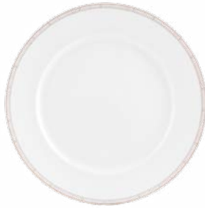
Plat rond plat Flat dish Ø : 31,5 cm - 12.4" Réf. 31370 128 0031