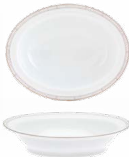
Baker Vegetable dish L : 23,6 cm - 9.2" l : 18,5 cm - 7.2" Réf. 31370 301 0078