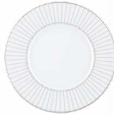
Assiette à dessert Dessert plate Ø : 24,5 cm - 9.6" Réf. 31370 354 0007