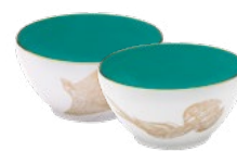
Bol Bowl Ø : 12,5 cm H : 6,5 cm Ø : 4.9" H : 2.6" Ref. 30096 537 0325