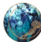
Assiette à pain Méduse Bread & butter plate Jellyfish Ø : 16 cm – 6.3" Ref. 30097 550 0010