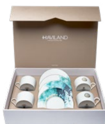
Coffret de 4 tasses & soucoupes thé Set of 4 tea cups & saucers Ref. 30096 501 2636