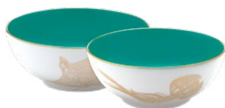
Saladier MT Medium salad bowl Ø : 23 cm Ø : 9.1" Ref. 30096 512 0053