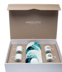
Coffret de 4 tasses & soucoupes café Set of 4 coffee cups & saucers Ref. 30096 501 2637