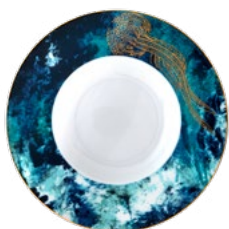
Assiette à pâtes GT Large pasta plate Ø : 28,5 cm – 33 cl Ø : 11.2" – 11.2 oz Ref. 30096 554 0130