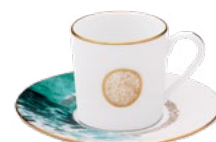
Tasse et soucoupe café Coffee cup & saucer Ø : 12 cm H : 6 cm – 9 cl Ø : 4.7" H : 2.4" – 3.1 oz Ref. 30096 501 2231