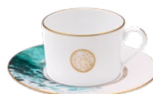
Tasse et soucoupe thé Tea cup & saucer Ø : 16,5 cm H : 5,5 cm – 16 cl Ø : 6.5" H : 2.2" – 5.4 oz Ref. 30096 501 2234