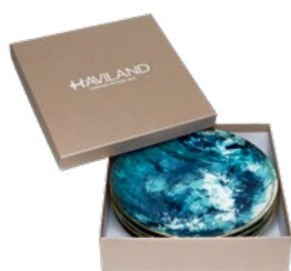
Coffret de 4 assiettes dessert Set of 4 dessert plates Ref. 30096 511 2655