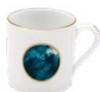
Mini-mug mini-mug Ø : 7 cm H : 6,9 cm – 15 cl Ø : 2.8" H : 2.7" – 5.1 oz Ref. 30096 501 2218