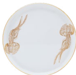
Plat à tarte Tart platter Ø : 31,5 cm Ø : 12.4" Ref. 30096 511 0071