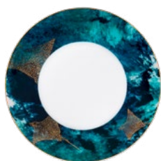
Assiette gastronomie Large dinner plate Ø : 28 cm – 11" Ref. 30096 548 0022