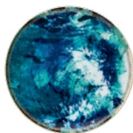
Assiette dessert Dessert plate Ø : 22,5 cm – 8.9" Ref. 30096 511 1021