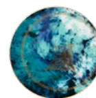
Assiette à pain Raie Bread & butter plate Ray Ø : 16 cm – 6.3" Ref. 30096 550 0010