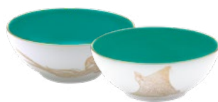
Saladier PT Small salad bowl Ø : 20 cm Ø : 7.9" Ref. 30096 512 0054