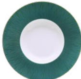
Assiette Creuse à aile Lierre Rim soup plate Ø : 28 cm, Ø: 11" Réf. 31938 393 0130