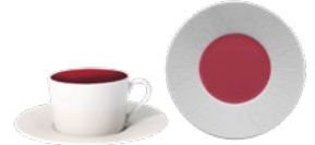
Tasse et Soucoupe Thé cyl Rose Daphnée Tea Cup and Saucer cyl Ø : 16 cm, 16 cl Ø: 6.2", 5.4 oz Réf. 31940 393 2234