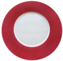
Assiette Gastronomie Rose Daphnée Large Dinner Plate Ø : 29,5 cm, Ø: 11" Réf. 31940 393 0022