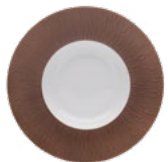
Assiette Creuse à aile Brun Piemont Rim soup plate Ø : 28 cm, Ø: 11" Réf. 31937 393 0130