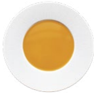
Assiette à Dessert Jaune Dessert Plate Ø : 24,5 cm, Ø: 9.6" Réf. 31939 393 0007