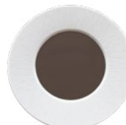
Assiette à Dessert Brun Piemont Dessert Plate Ø : 24,5 cm, Ø: 9.6" Réf. 31937 393 0007