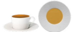
Tasse et Soucoupe Thé cyl Jaune Tea Cup and Saucer cyl Ø : 16 cm, 16 cl Ø: 6.2", 5.4 oz Réf. 31939 393 2234