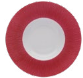
Assiette Creuse à aile Rose Daphnée Rim soup plate Ø : 28 cm, Ø: 11" Réf. 31940 393 0130