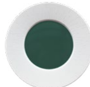
Assiette à Dessert Lierre Dessert Plate Ø : 24,5 cm, Ø: 9.6" Réf. 31938 393 0007