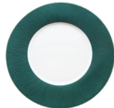
Assiette Gastronomie Lierre Large Dinner Plate Ø : 29,5 cm, Ø: 11" Réf. 31938 393 0022