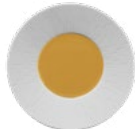
Assiette à Pain Jaune Bread and Butter Plate Ø : 16 cm, Ø: 6.2" Réf. 31939 393 0010