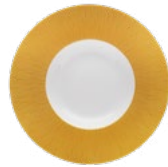
Assiette Creuse à aile Jaune Rim soup plate Ø : 28 cm, Ø: 11" Réf. 31939 393 0130