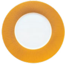
Assiette Gastronomie Jaune Large Dinner Plate Ø : 29,5 cm, Ø: 11" Réf. 31939 393 0022

DÉCOR JAUNE 31939 DÉCOR ROSE DAPHNÉE 31940 DÉCOR LIERRE 31938 DÉCOR BRUN PIEMONT 31937