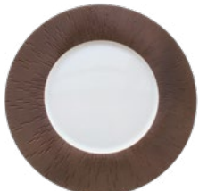
Assiette Gastronomie Brun Piemont Large Dinner Plate Ø : 29,5 cm, Ø: 11" Réf. 31937 393 0022