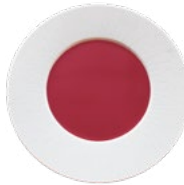
Assiette à Dessert Rose Daphnée Dessert Plate Ø : 24,5 cm, Ø: 9.6" Réf. 31940 393 0007