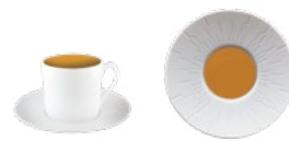
Tasse et Soucoupe Café cyl Jaune Coffee Cup and Saucer cyl Ø : 12 cm, 9 cl Ø: 4,7", 3 oz Réf. 31939 393 2231